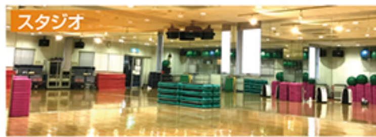
初めての方でも安心してご参加できる多彩なプログラムをご用意しております。