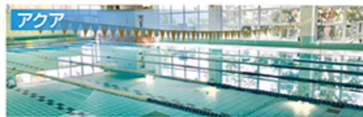
【25mプール】6コース(水深1.1m)の本格的競泳プール 【多目的プール】可動する床で水深が、50cm～2mまで変化する多機能プール