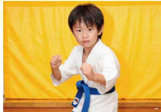
ジュニア空手教室