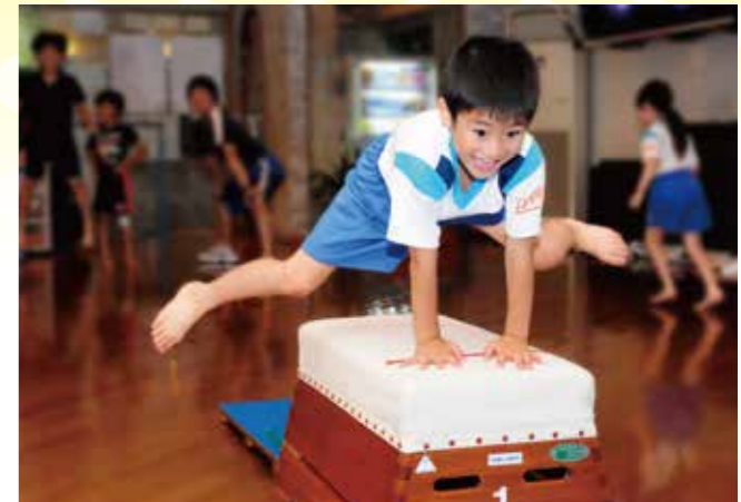
スマイル体育教室