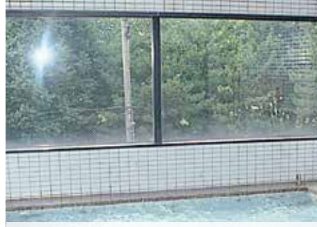
リラクゼーション