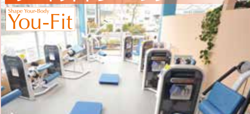
Shape Your-Body You-Fit