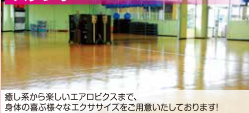
癒し系から楽しいエアロピクスまで、身体の喜び様々なエクササイズをご用意しております!