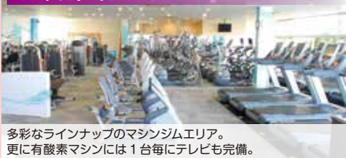
多彩なラインナップのマシジムエリア。更に有酸素マシンには1台毎にテレビも完備。