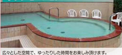
広々とした空間で、ゆったりした時間をお楽しみ頂けます。