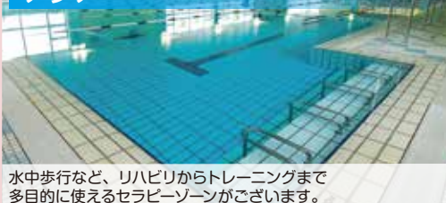
水中歩行など、リハビリからトレーニングまで多目的に使えるセラピーゾーンがございます。