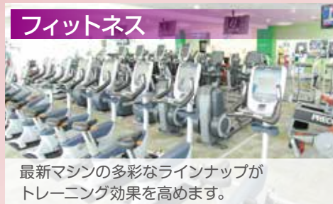
最新マシンの多彩なラインナップがトレーニング効果を高めます。