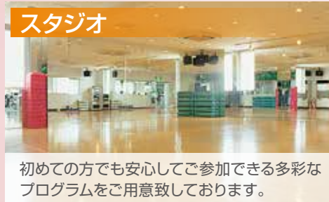
初めての方でも安心してご参加できる多彩なプログラムをご用意しております。