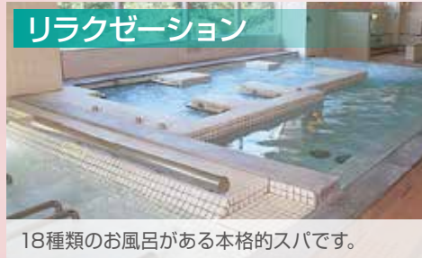
18種類のお風呂がある本格的スパです。