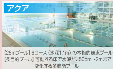
【25mプール】6コース(水深1.1m)の本格的競泳プール 【多目的プール】可動する床で水深が、50cm~2mまで変化する多機能プール