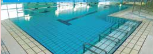
水中歩行など、リハビリからトレーニングまで多目的に使えるセラピーゾーンがございます。