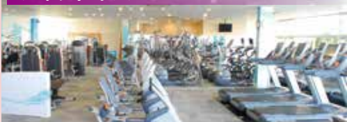
多彩なラインナップのマシジムエリア。更に有酸素マシンには1台毎にテレビも完備。