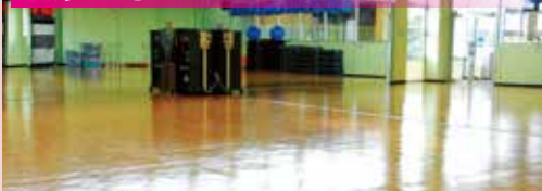
癒し系から楽しいエアロピクスまで、身体の喜び様々なエクササイズをご用意しております!