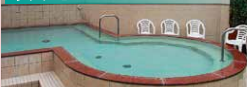
広々とした空間で、ゆったりした時間をお楽しみ頂けます。