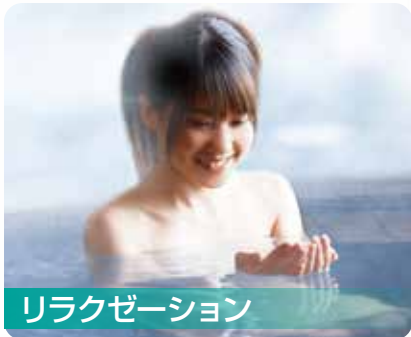
リラクゼーション