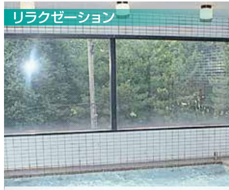
リラクゼーション