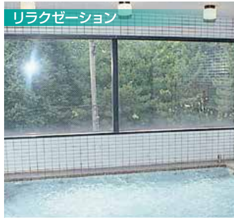
リラクゼーション

水中でしか味わえない!4つの効果!! ①『浮力』水の浮力で体が軽くなり、無理なく『全身運動』をすることができます。 ②『水圧』血液循環が良くなり『むくみ』や『肩こり』等の改善が期待されます。 ③『抵抗』陸上よりも抵抗が多い分『効率良くカロリー消費』することができます。 ④『水温』免疫力アップが期待でき、『風邪を引きにくく』なります。