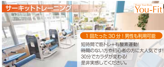
サーキットトレーニング

癒しのスパ! 露天風呂がおすすです! 季節によって変化する癒しの緑花と露天風呂では珍しい大型テレビを設置しております。 ぜひ、この心地よい空間で運動後の疲れを癒してください!